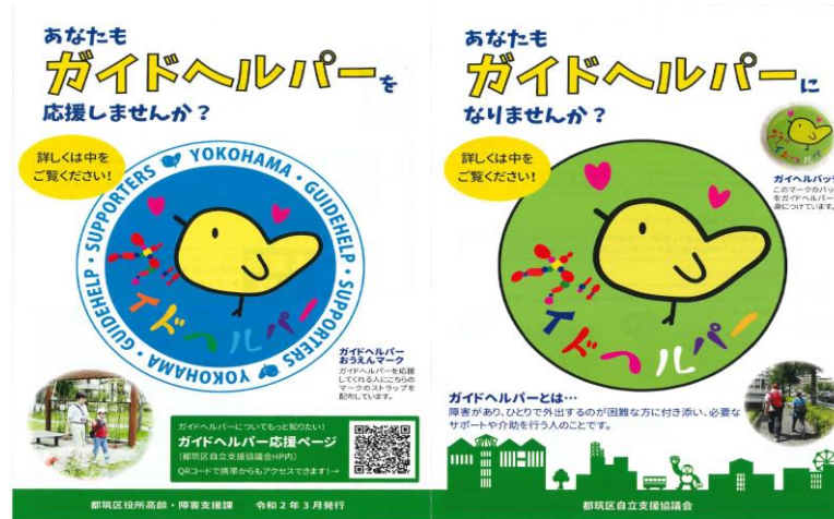
ガイドヘルパー応援チラシ