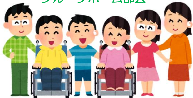
グループホーム部会