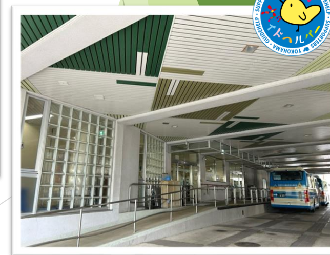
北綱島特別支援学校